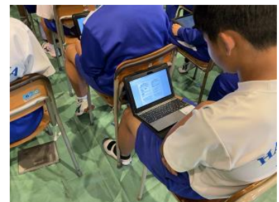
GIGA端末で議案書を確認する生徒

という話があり、生徒総会が開会しました。生徒総会をきっかけとして、生徒によるさまざまな自治活動を全校生徒に見えるようにしていくことが大切です。また、その取り組みの中で、今ある学校生活を少しずつ改善し、昨年度よりも今年度がよりよくなるよう、全校生徒が知恵を出し合い、自分事として取り組んでくれることを期待しています。