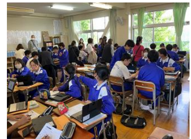
3年1組 技術の授業の様子

なお、次回の授業参観の予定は、7/12(金)を予定しております。是非ともご参観いただきますようお願いいたします。